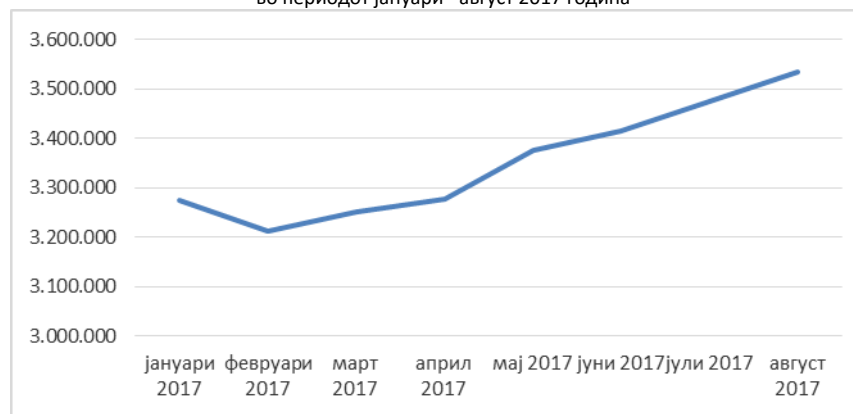
Графички приказ на движењето на долговите на ЈЗУ во периодот јануари –август 2017 година

Вкупните долгови на ЈЗУ на 31.08.2017 година изнесуваат 3.534.758 илјади денари и во однос на м.декември 2016 година (3.310.318 илјади денари) бележат зголемување од 6,8%.